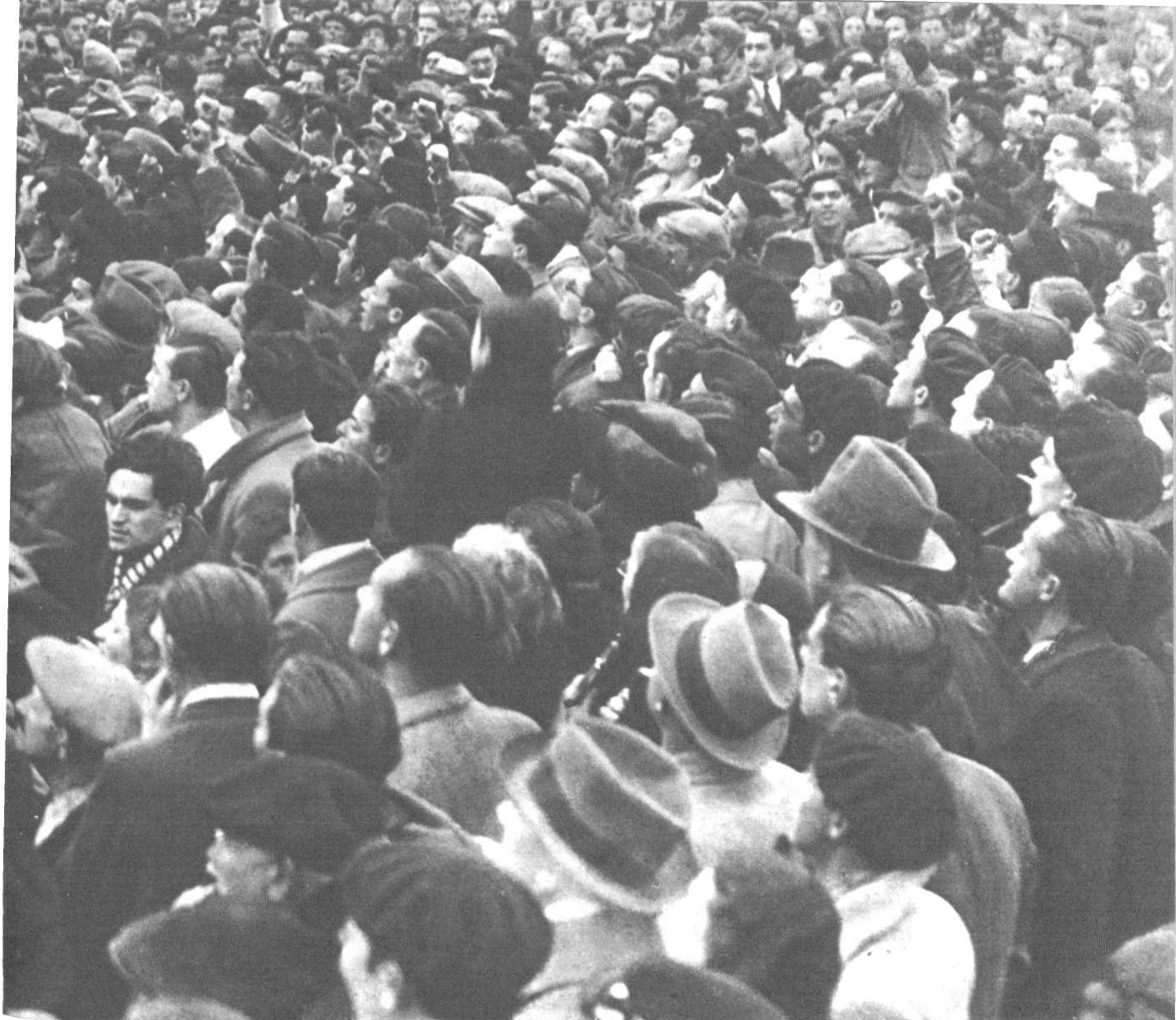
Bajo el signo de la Libra, el cual es regido por Venus, era, por consiguiente, el pueblo que ascendía al Poder

dríd es favorable a la República, y la influencia de la Luna acentúa el carácter democrático del Gobierno. Muy cerca del ascendiente se encuentra la estrella fija Vindemiatrix, y esto expresa, tratándose de una persona, viudedad o próximo divorcio. Vean los lectores cómo se transmuta la Astrología individual a la Astrología de los pueblos: el signo astrológico se ha cumplido, en efecto, casi en su principio, por el divorcio de la República con su Presidente.