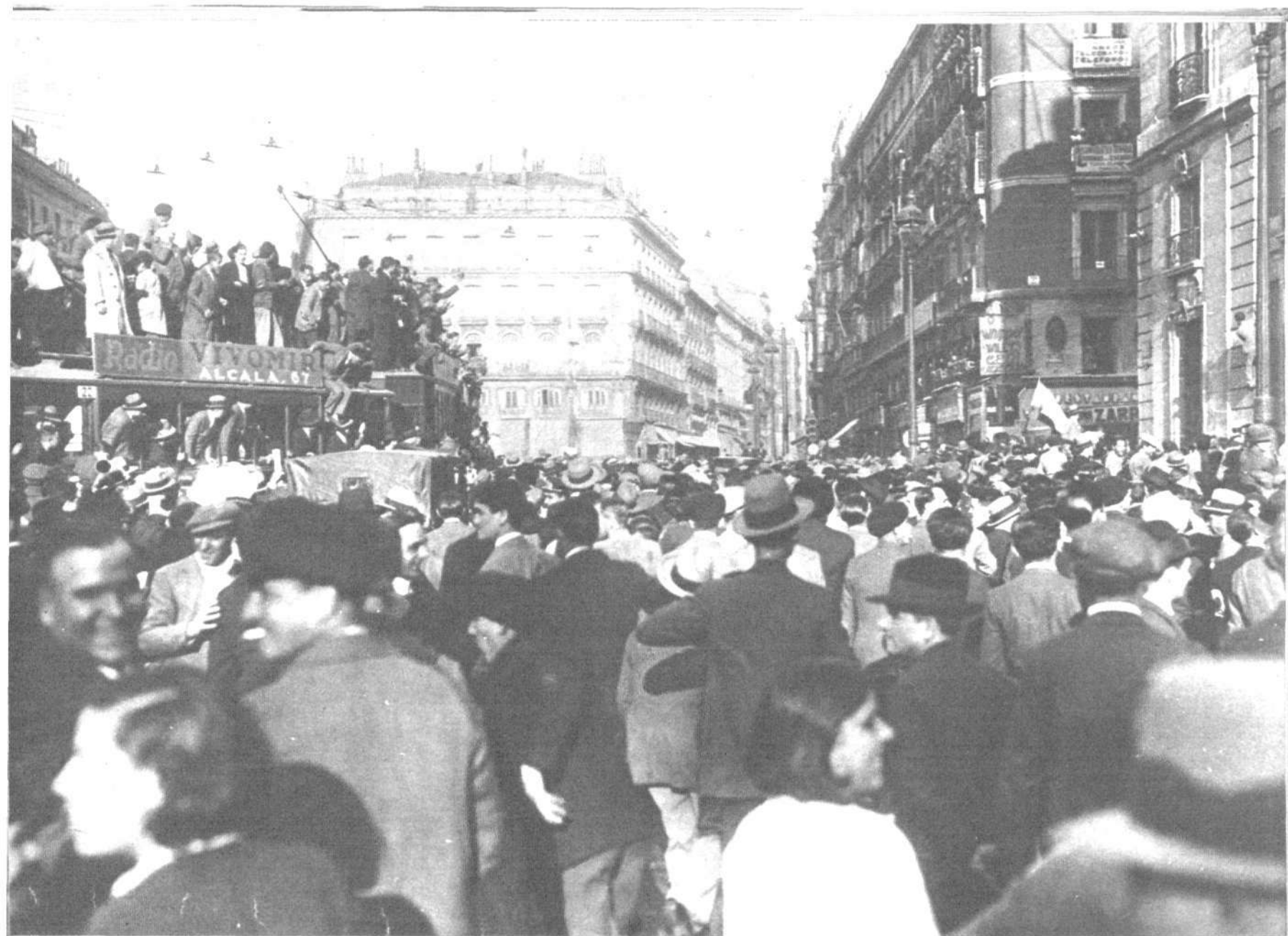
La República española ha nacido—dice Kerneiz— en una de esas épocas perturbadoras que vuelven periódicamente, y durante las cuales la Humanidad cambia de piel, del mismo modo que un crustáceo cambia de caparazón