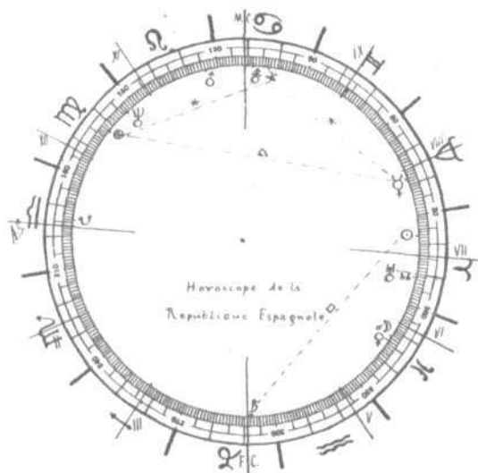
Horóscopo de la República española, establecido por el célebre astrólogo Kerneiz

Restringiremos por hoy nuestras investigaciones a un futuro más próximo. Es una tradición de la astrología establecer un mapa del cielo en el momento en que empieza el año astrológico, acontecimiento celestial que se ha producido este año el 20 de Marzo, a las 6 horas 58 minutos de la tarde, hora de Greenwich. Las configuraciones astrales que predominaban, cuyos pronósticos se pueden aplicar al mundo entero, eran de tal naturaleza, que podían despertar las más legítimas inquietudes. Temo mucho que este período de doce meses, en el cual hemos entrado, sea, no solamente agitado, sino hasta sangriento. El mapa establecido para Ma-