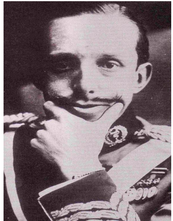
Alfonso XIII pagó caro el apoyo de la monarquía a la dictadura de Primo de Rivera.

En la Puerta del Sol, A las 17:30 horas, se proclamó la República, y a las 20 horas, minutos antes de que el rey abandonará Madrid, Niceto Alcalá Zamora proclamaba por radio su nacimiento a todo el país.