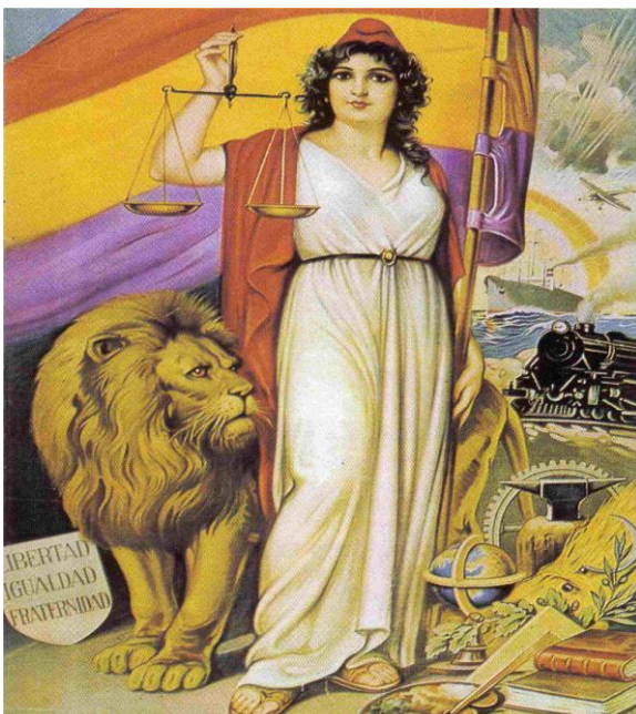
Alegoría de la II República española , de la que se esperaba justicia, prosperidad, progreso y cultura.

El martes 14 de abril amaneció radiante y la gente se echó a la calle para celebrar los resultados de las elecciones municipales celebradas el domingo anterior. Sólo se conocían los resultados parciales de las capitales de provincia, pero se sabía que los partidos antimonárquicos (republicanos, socialistas y comunistas) habían derrotado a los monárquicos y, dado el carácter plebiscitario -¿República o Monarquía?- que había tenido la campaña, la conclusión era evidente: la monarquía había sido derrotada y debía proclamarse la República. Al rey, sólo le quedaba el exilio o resistir ante lo inevitable. Eligió la primera opción, no sin antes comprobar que la Monarquía había perdido todos sus apoyos, sobre todo el sostén de las fuerzas armadas. Ese mismo día, solo y aturcido, Alfonso XIII abandonó el país para no volver nunca más.