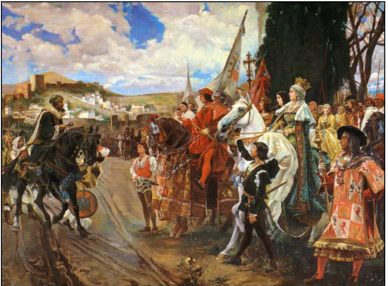
La rendición de Granada, por Francisco Padilla. Museo del Prado.

Para la tradición, España es un reino de Sagitario, y suele tomarse como tema del país la coronación de Isabel la Católica (1474) como reina de Castilla,